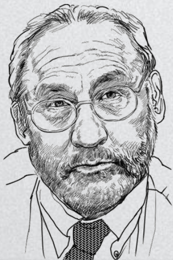
诺贝尔经济学奖得主 斯蒂格利茨

21世纪对世界影响最大的有两大事件，一件是美国 高科技 产业的发展，另一件就是中国的 城镇化 。